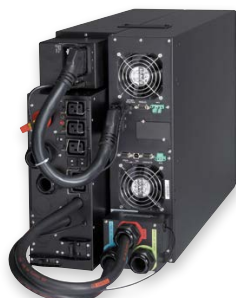
Eaton 9PX 11kVA mit Wartungsbypass